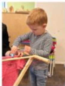
ZELF DE WAS OPHANGEN

In de schoolbibliotheek gaan we op zoek naar prentenboeken passend bij het thema!