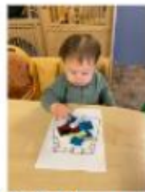
Eigen kleding ontwerpen