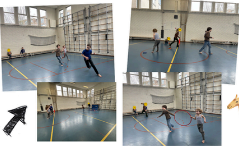
We spelen dierspelletjes in de gymzaal!