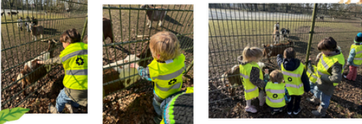
Op naar buiten! We nemen een bezoek aan de hertjes.