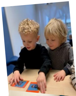
Memory spelen met plaatjes uit het prentenboek 'Vos gaat een stukje rijden'.