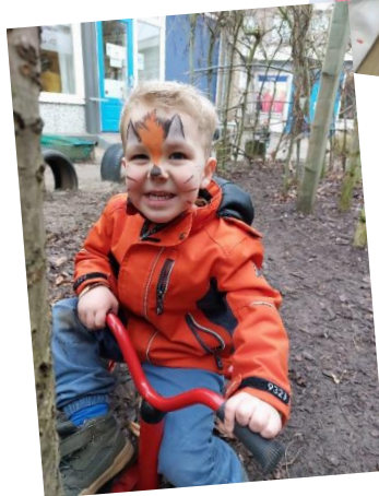
Tot de volgende keer vos!